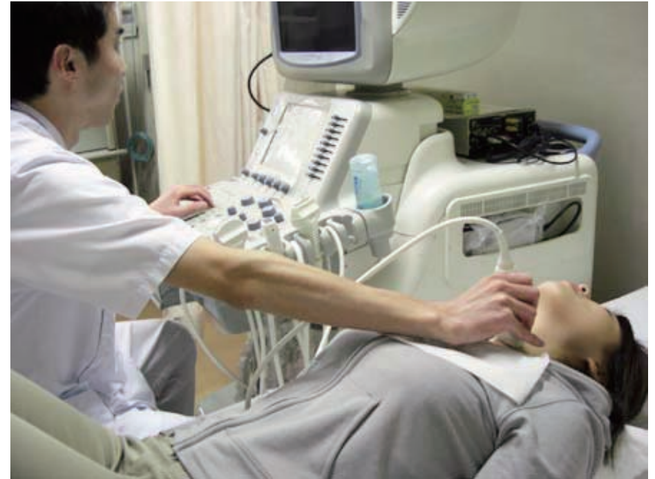
超音波（エコー）検査

超音波（エコー）検査、ラジオアイソトープを使った検査などがあります。また、針で甲状腺を穿刺して、細胞をとって調べる検査（バイオプシー）もあります。